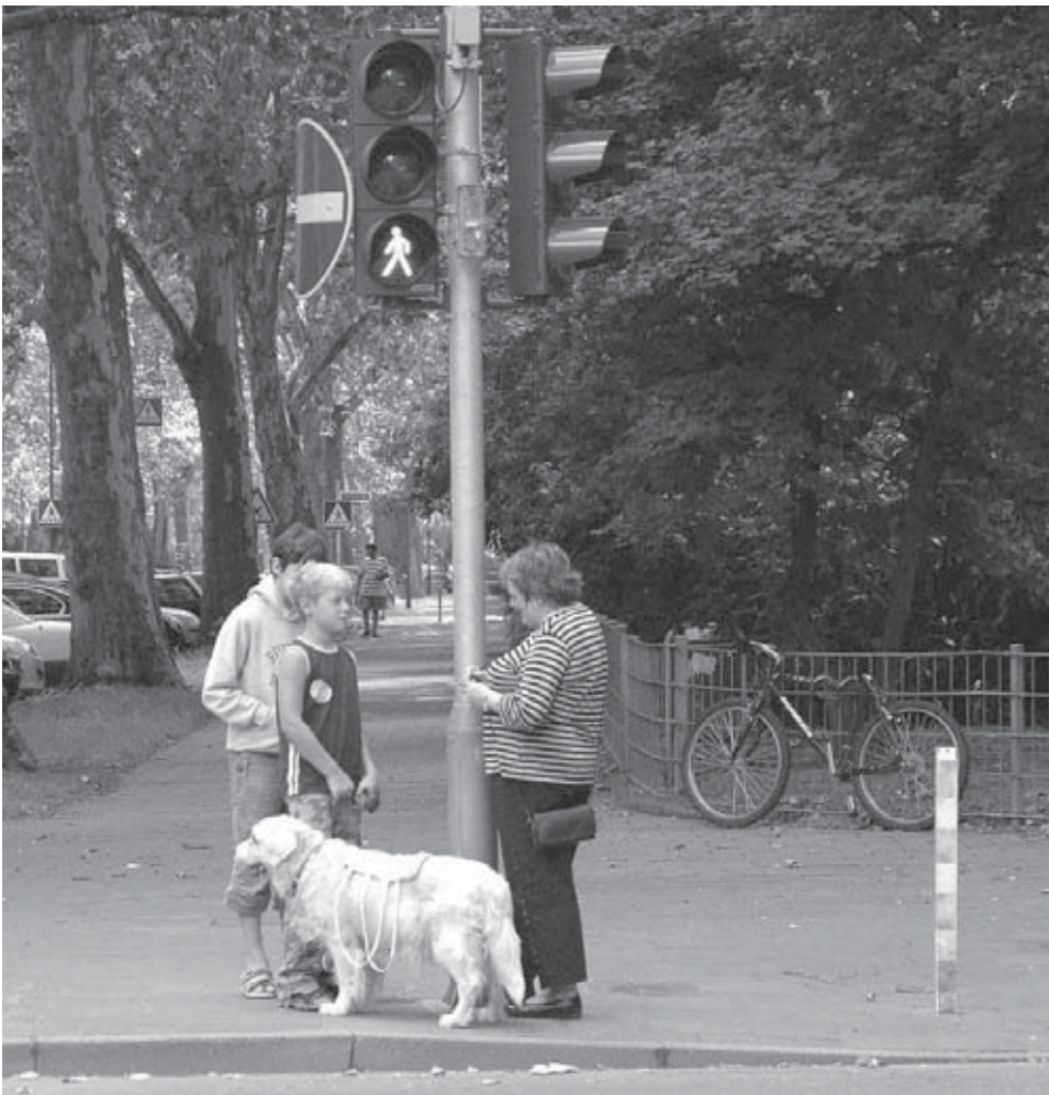
Gemeinsam neue Wege gehen

Dem Rat der Stadt sind insgesamt zehn Maßnahmen vorgeschlagen worden. Zwei der wichtigsten sind: sich noch einmal auf die Entlastung der Angehörigen von Demenzerkrankten zu konzentrieren und mehr Personalstellen zu bewilligen.