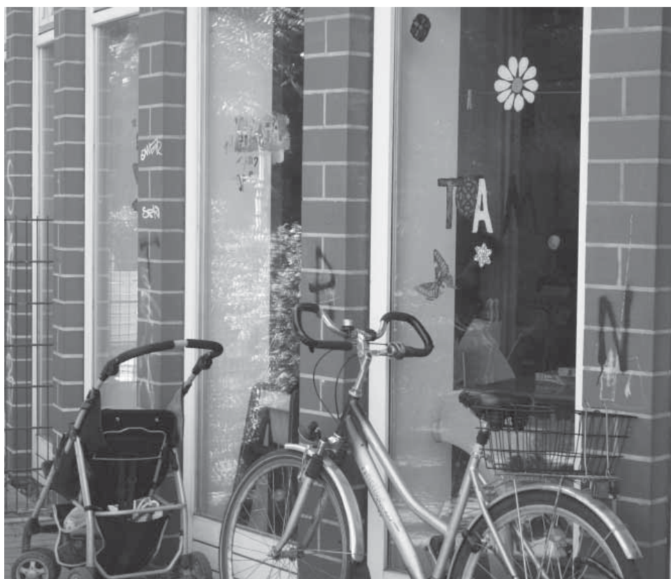
Treffpunkt für Jung und Alt