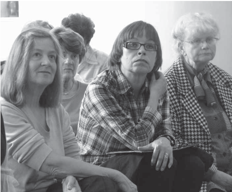
Generationenübergreifend aktiv gestalten

Auch auf Ebene der Bundesländer und des Bundes muss die gemeinwesenorientierte Altenarbeit weiter gestärkt werden. Die Altenberichte, die die Situation und die Bedürfnisse älterer Menschen in Deutschland beleuchten, bieten eine umfassende Grundlage für die Gestaltung einer generationensolidarischen Gesellschaft. Innovationsprogramme des Bundes und der Länder, die Anschubfinanzierungen gewähren, bleiben weiter sinnvoll. Solche Gelder ergänzen, befristet für die Förderdauer, die Finanzierungsgrundlagen auf kommunaler Ebene. Projekte der Altenarbeit im Gemeinwesen, deren Nutzen nachgewiesen wurde, gilt es zu verstetigen und zu verbreiten: Im rechtzeitigen Austausch über erfolgreiche Beispiele mit allen Verantwortungsträgern wird sichergestellt, dass wirksame Angebote nach Ende der Bundes- oder Landesförderung nicht enden.