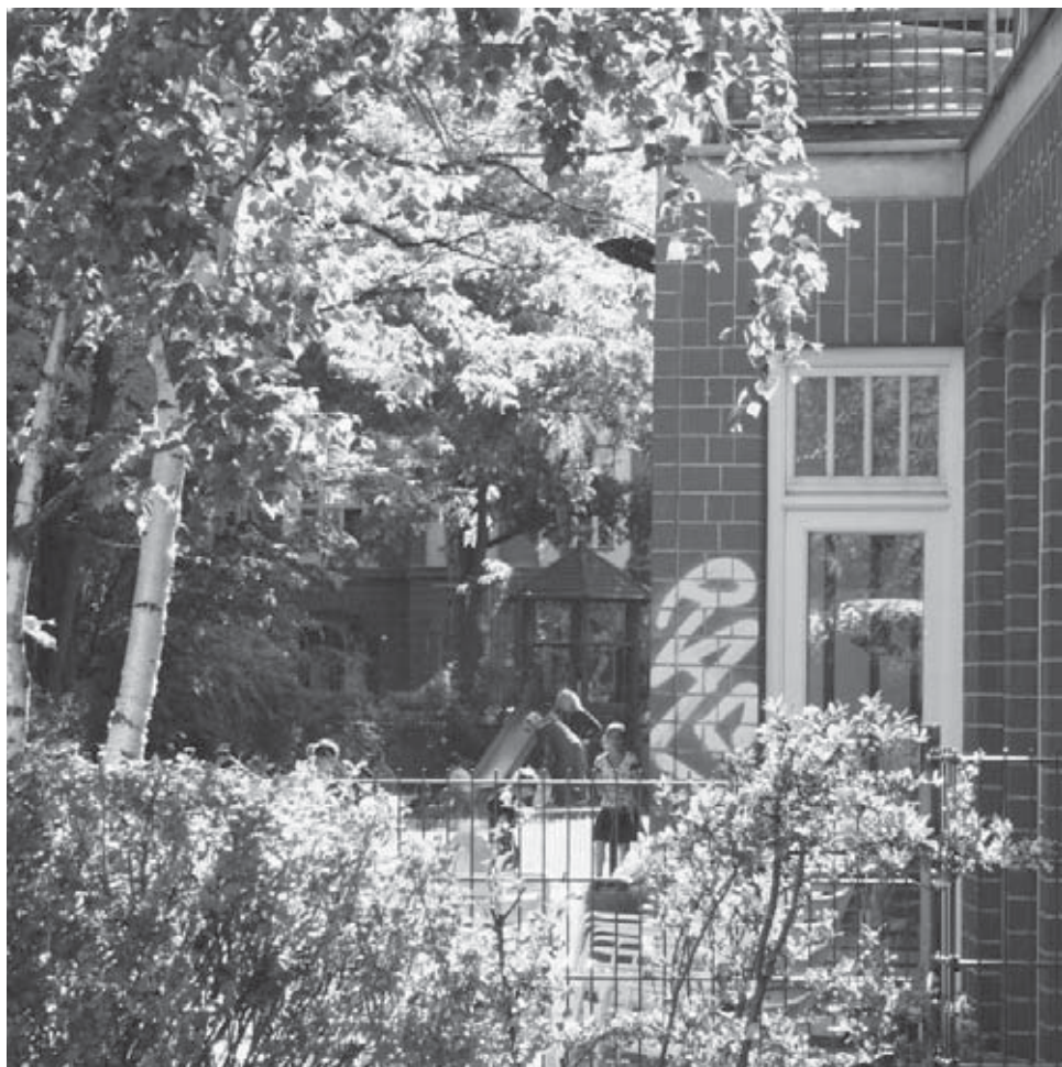
Das Miteinander lässt Sozialräume gedeihen

Bildungsangebote sollen nicht allein für professionelle Mitarbeiterinnen und Mitarbeiter entwickelt werden. Unter der Vorgabe des „lebensbegleitenden Lernens“ sind die Lern- und Bildungspotenziale älterer Menschen selbst zu fördern.