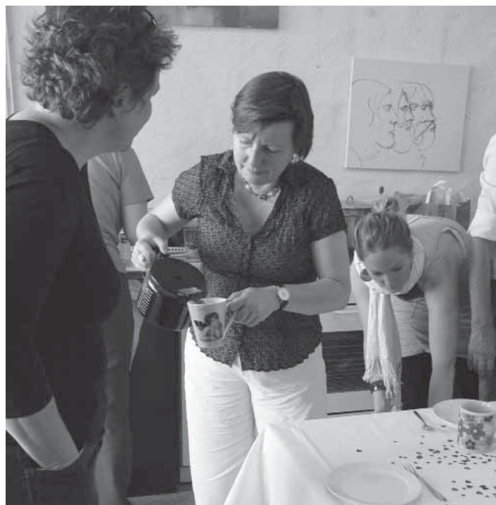
Soziale Kontakte pflegen

Krankenkassen können noch stärker in präventive Angebote im Rahmen der gemeinwesenorientierten Altenarbeit eingebunden werden. Solche Ko-Finanzierung ist gemeinsam mit Anbietern, Kommune und Krankenkasse auszuloten.