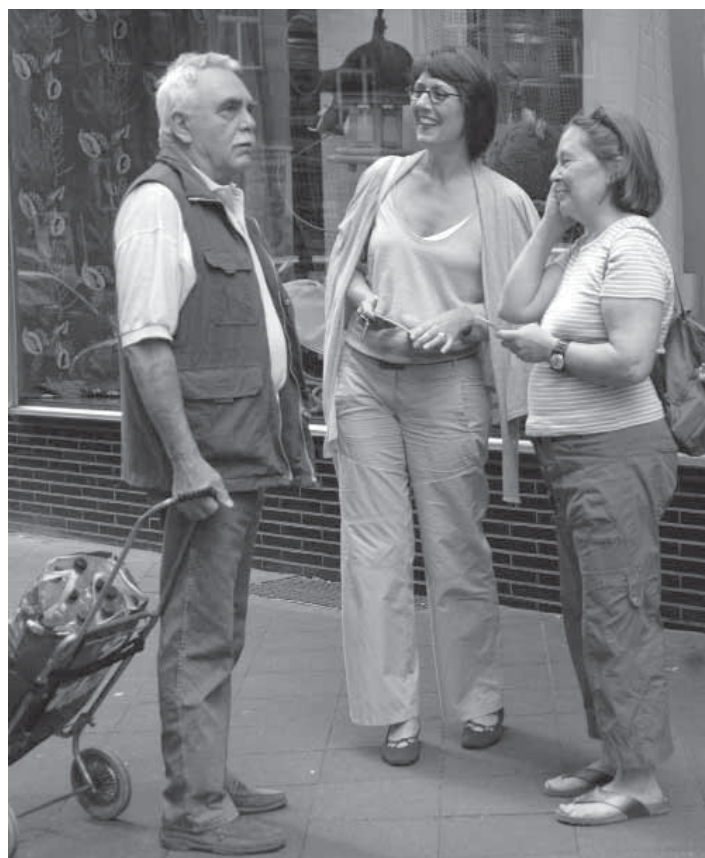
Nachbarn kennen und begegnen sich

Der Leistungserbringer trägt das wirtschaftliche Risiko für eine gesamtgesellschaftliche Aufgabe weitgehend allein. Der Landkreis nimmt die sich verändernde demografische Situation zum Anlass, Angebote für eine wachsende Bevölkerungsgruppe, Senioren, zu implementieren und zu verstetigen. Die Förderung ist eine freiwillige Leistung des Landkreises, die jährlich neu beantragt werden muss. Die Unterstützung durch die Evangelische Landeskirche ist abhängig von Spenden. Eigenmittel des Trägers ergeben sich aus den Mitgliedsbeiträgen, Teilnehmerbeiträgen und sonstigen Mitteln. Bundes- und Landesförderungen sind projektbezogen und zeitlich befristet. Der Verein entspricht durch die Qualifizierung seiner Mitarbeitenden, einer Fülle