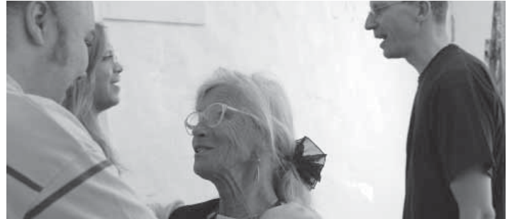
Miteinander sprechen über meine und deine Welt