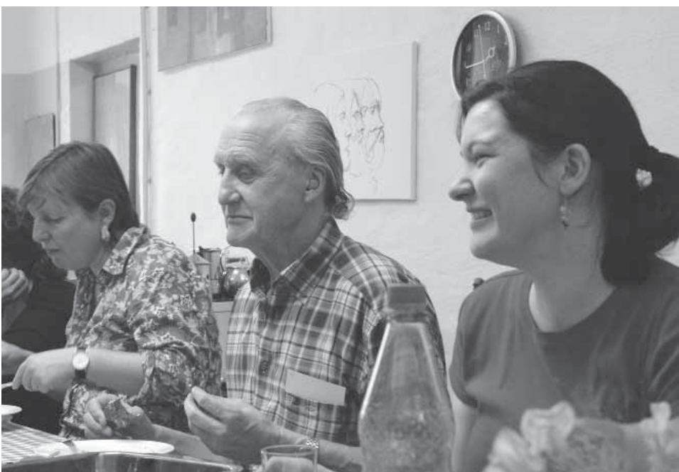
Gemeinsam macht's mehr Spaß

Die altersgerechte Quartiergestaltung nach dem Konzept WohnQuartier 4 kann zu einer Ausweitung von Teilnahme und Teilhabe, zu einer Rückgewinnung nachbarschaftlicher Strukturen, zu neuen Netzwerken und Kooperationen im Quartier führen. Damit kann die „Ertüchtigung“ der Quartiere für den demografischen Wandel insgesamt und die möglichst lange selbstbestimmte Lebensführung der einzelnen Bewohnerinnen und Bewohner maßgeblich befördert werden. Perspektivisch ist die Erweiterung der Zielstellung „altersgerecht“ hin zu „inklusiven“ Quartieren anzustreben, also die Ermöglichung eines möglichst selbstbestimmten Lebens und größtmöglicher gesellschaftlicher Teilhabe für alle Menschen mit individuellen (körperlich, geistigen, seelischen) Beeinträchtigungen und unterschiedlichen Graden an Unterstützungsbedarf.