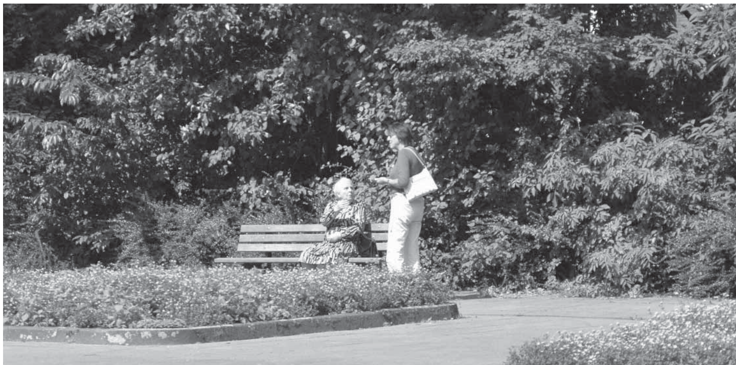
Ort der Begegnung im Quartier

Lange Tradition der Offenen Altenarbeit innerhalb der Stadtmission Nürnberg