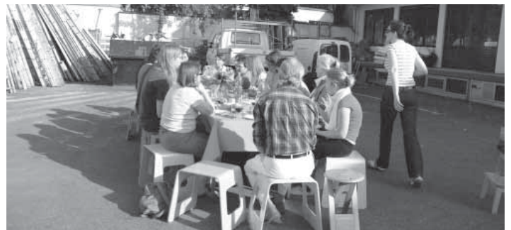
Kommunikationstreffen am „Eckigen Tisch“

Jede Einrichtung erstellt ein individuelles Konzept, entsprechend ihren spezifischen Besonderheiten zu Lage, Struktur und Inhalten. Es ist darzustellen, wodurch gemeinwesenorientierte Altenarbeit am konkreten Standort der Einrichtung lebt.